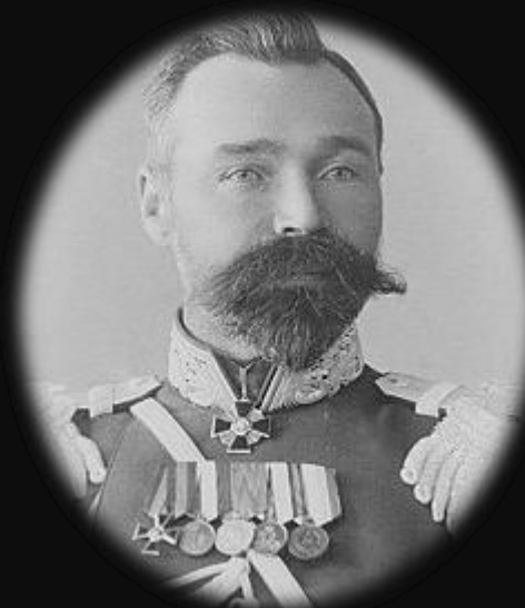
Р.О. Кондратенко командующий обороной «Порт-Артура»