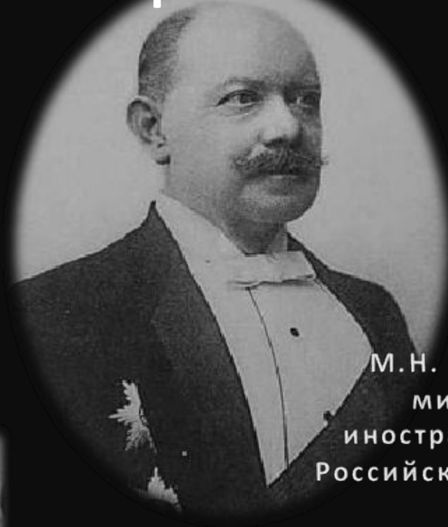
М.Н. Муравев министр иностраннх дел Российской империи