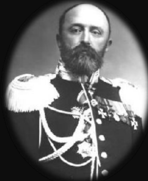
В.Ф. Руднев капитан крейсера «Варяг»