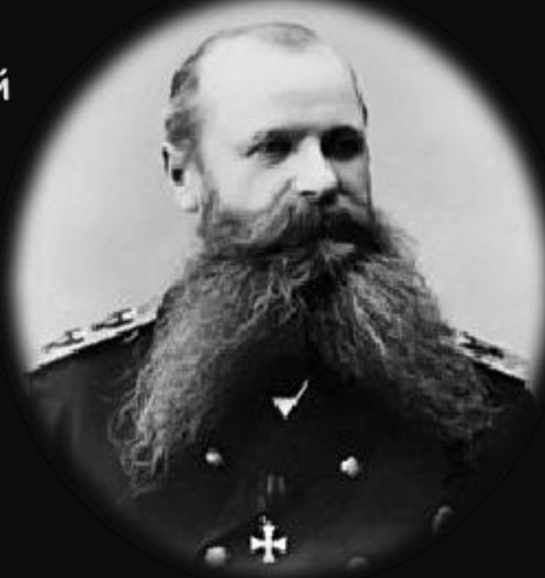
С.О. Макаров командующий Тихоокеанской эскадрой