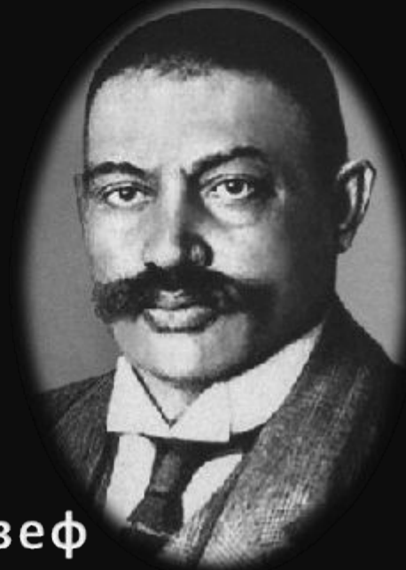
Е. А. Азеф