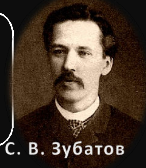
С. В. Зубатов

Особенно мощными стали волнения рабочих на Обуховском заводе в Петербурге в 1901г. (Обуховская оборона).