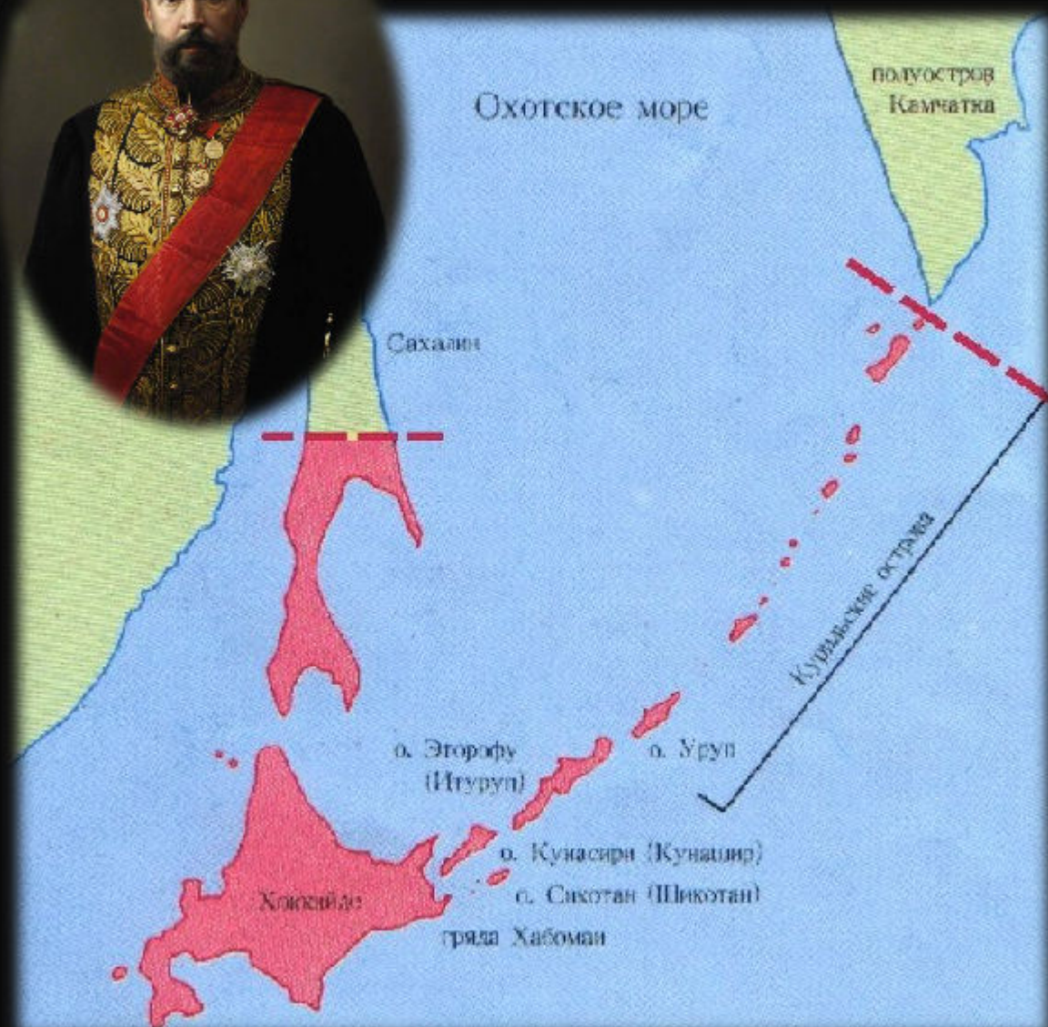
Территориальные изменения по итогам Портсмутского мирного договора