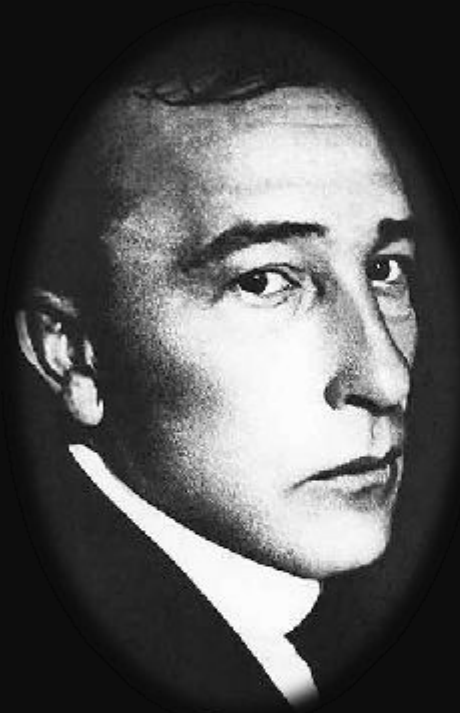
Б. В. Савинков.