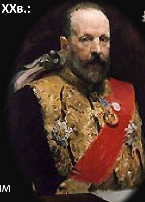
С.Ю Витте – министр финансов РИ