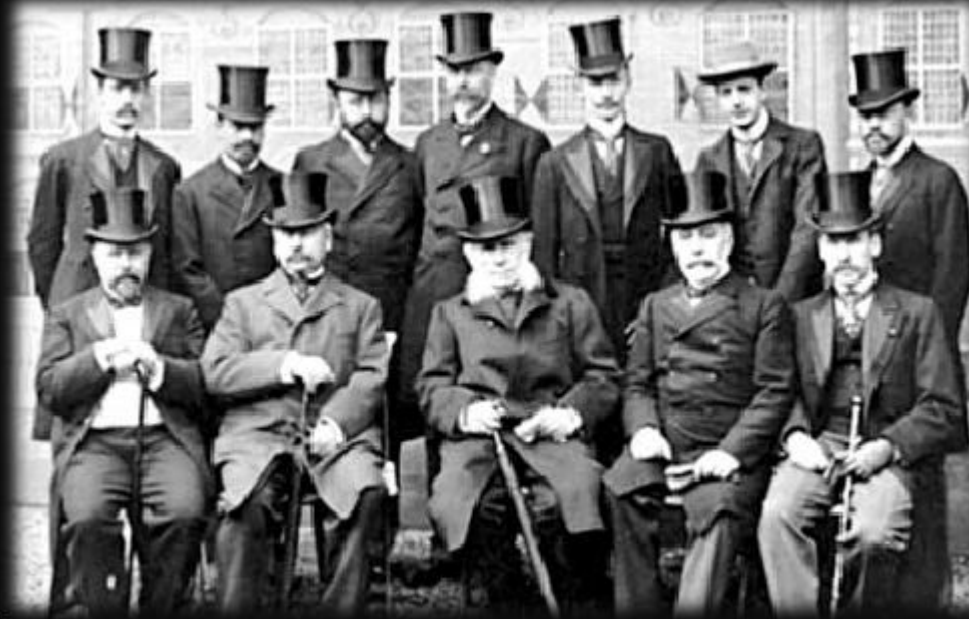
Делегация РИ на гаагской конференции